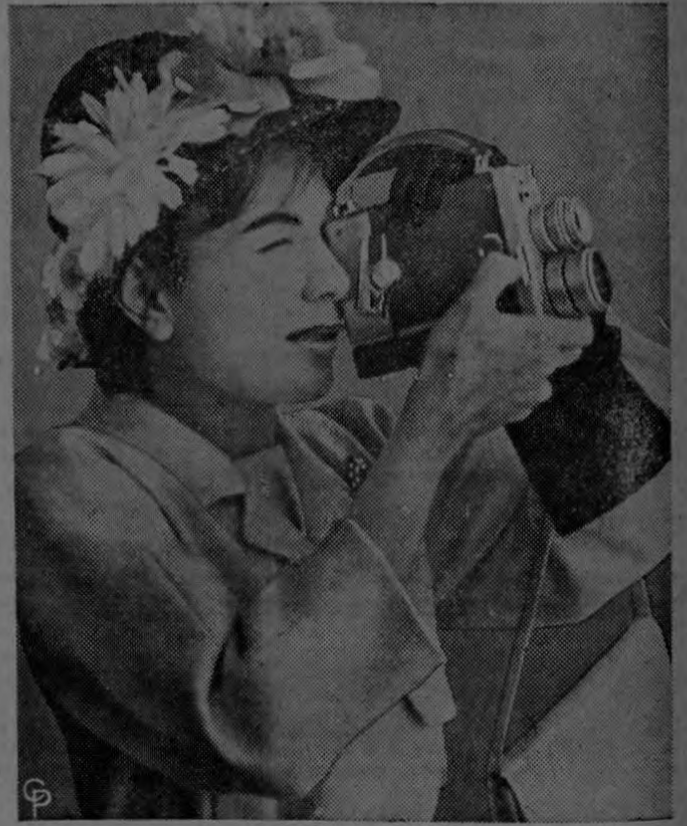
VISITA FERIA MUNDIAL.— La reina Farah de Irán posa para un fotógrafo mientras toma una película de la Feria Mundial de Seattle. La soberana y su esposo, el Shah Mohammed Razi Pahlevi, formaron parte de los millares de visitantes que acudieron a la Feria en su inauguración.

Han de ser verdes y no muy grandes. Los amarillos y muy grandes están huecos o llenos de semilla.