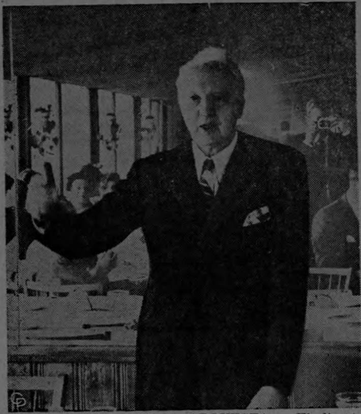
DIRIGIRA NUEVA ORQUESTA.— El director de orquesta Leopold Stokowski hace público en Nueva York que se propone organizar una nueva orquesta sinfónica en esta ciudad. Stokowski, quien dirigirá dicha orquesta, dijo que la misma habrá de ofrecer recitales en el Carnegie Hall. Los precios de entrada serán moderados, oscilando entre $ 1.50 a $ 5.00.