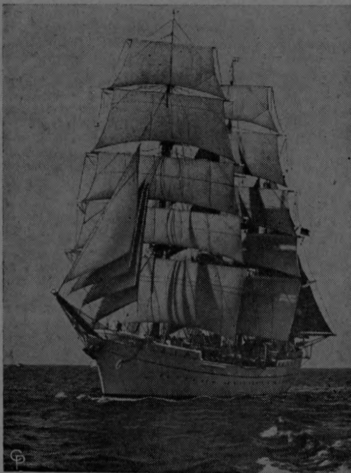
BUQUE ESCUELA ALEMAN.— Esta fragata de tres mástiles, Gorch Fock, de la Marina Federal Alemana, navega por el Atlántico hacia Nueva York. La nave fue construida en Hamburgo y está siendo usada como buque escuela para entrenar a los marinos de la Alemania Occidental. La fragata tiene 300 pies de largo, tiene una manga de 40 pies y desplaza 1.870 toneladas y tiene un total de 20.000 yardas de área en sus velas.

Los "tarecos" o "tereques" (ambas forma consigna la Academia como americanismos) no son americanos de origen. Se usan también en Canarias y en Portugal, y su origen es árabe.